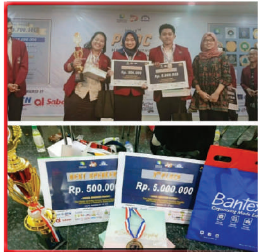
Juara 3 Perbanas Marketing Debate Competition 2019