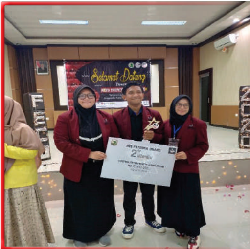
Juara 2 FATERNA ENTREPRENEUR COMPETITION 2020