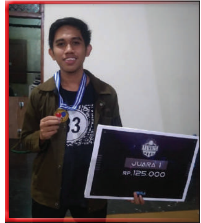
Telkom University Cup 2020 juara 1 tennis meja sejurusan teknik telekomunikasi