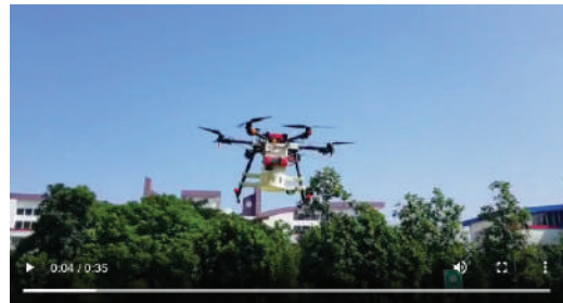
Semi Autonomous Drone untuk Penanggulangan Wabah Covid-19

Adapun prestasi dosen D3 TK adalah mendapatkan kesempatan mengajar sebagai dosen tamu di University Autonomi Barcelona.